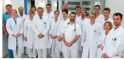
1. Medizinische Klinik