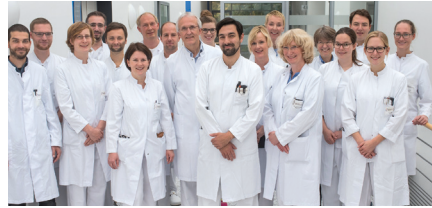
2. Medizinische Klinik