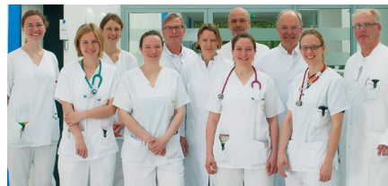
Klinik für Kinder- und Jugendmedizin