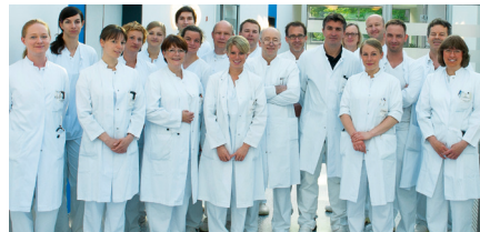
Klinik für Chirurgie