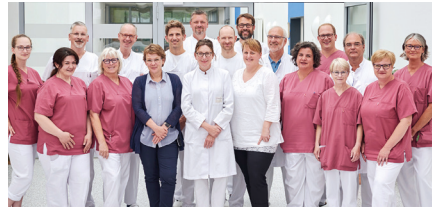
3. Medizinische Klinik